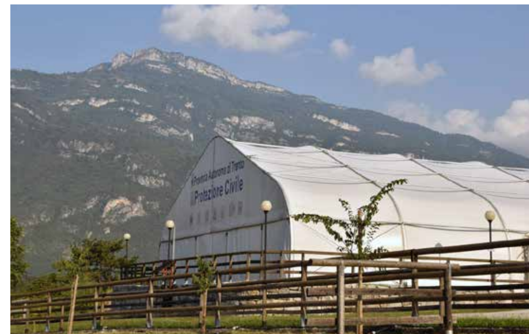
La mega tensostuttura che domina il campo Scuola Antincendi e Protezione civile di Marco di Rovereto, dove prima della pandemia l'Associazione Psicologi per i Popoli - TN organizzava annualmente campi estivi, ai quali partecipavano psicologi dell'emergenza provenienti da tutta Italia

Abbiamo già inoltrato la richiesta al Dipartimento trentino per poterlo organizzare nel fine settimana del 10-11-12 settembre, ferma restando l'attenzione alla gestione della sicurezza di tutti. Attendiamo una risposta. Molto dipenderà dalla disponibilità dell'area di Marco di Rovereto, che al momento è utilizzata