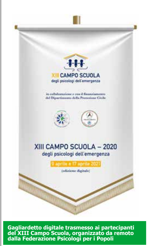
Gagliardetto digitale trasmesso ai partecipanti del XIII Campo Scuola, organizzato da remoto dalla Federazione Psicologi per i Popoli

Non ne ho esperienza diretta né dati, che non siano alcune statistiche nazionali sull'uso di psicofarmaci e ansiolitici. Desumo che per il Trentino non sia stato molto diverso... D'altronde è ragionevole che ci sia, in situazioni stressanti come quella che stiamo vivendo, un incremento nell'uso controllato di questi farmaci che aiutano la salute mentale e alleviano le sofferenze delle persone, senza cioè che se ne abusino: è sintomo della capacità dell'individuo di prendersi cura di sé, sapendo noi benissimo come sia invece difficile aiutare le persone avvicinandole a un percorso psicoterapico.