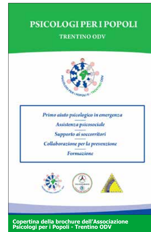
Copertina della brochure dell'Associazione Psicologi per i Popoli - Trentino ODV

emergere debolezze preesistenti. Ma il maggiore stress le ha portate a una nuova fase critica. A riprova, è il target di persone che si sono rivolte a noi: davvero insolito. Ovvero gli